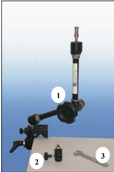
1/ Le support 7T21 / Support 2/ L'adaptateur rapide / Adaptor 3/ La clé fournie / Key supplied

To install the device on the support 7T21, follow the next steps.