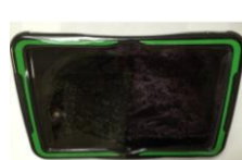
Protection Accent Open